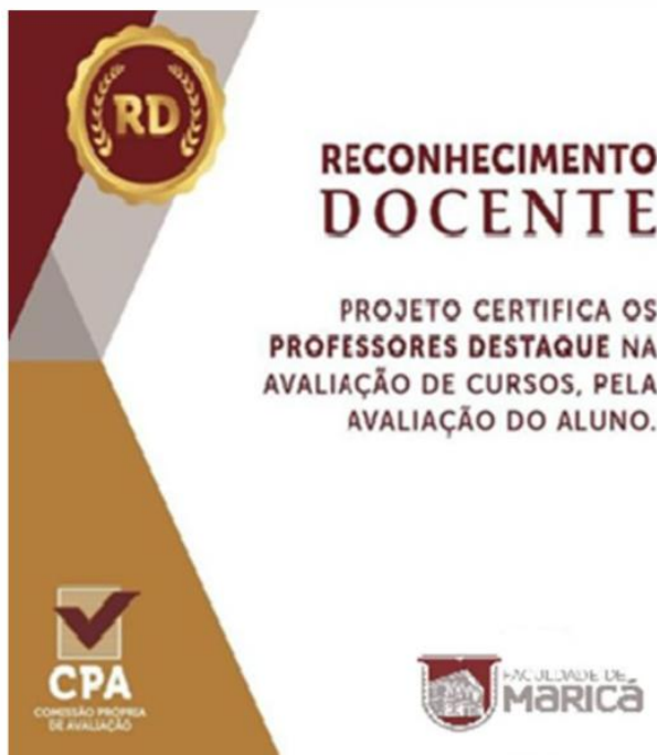
Figura 6. Material digital de divulgação do processo de avaliação Institucional.