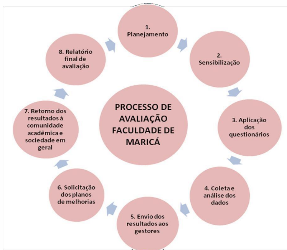
Figura 1. Diagrama do processo de avaliação institucional